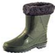
Сапоги ПВХ с мехом