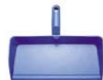
Совок ручной (большой)