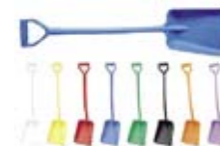
Лопата с короткой ручкой (широкая)