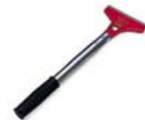
Скребок для пола