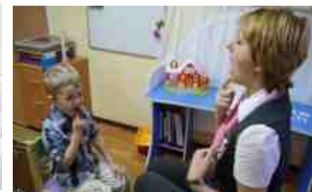
Метод формирования языковой системы

Дети–инвалиды после кохлеарной имплантации и слухопротезирования (В рамках путевки, ежегодный охват – 50 детей)