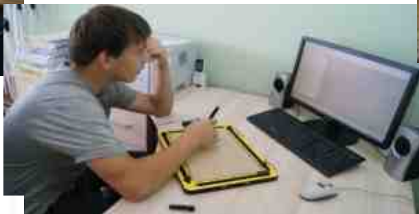
Универсальный цифровой планшет Tacti Pad