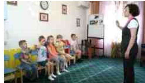
Комплексная методика «Логоритмика»