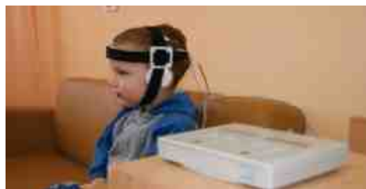
Метод транскраниальной микрополяризации на аппарате "РЕАМЕД-Полярис"