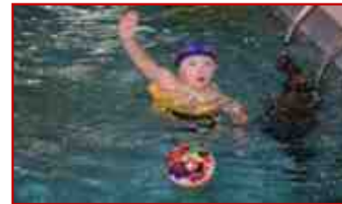
Областной реабилитационный центр «Родник»