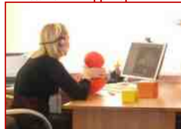
Видеоконсультирование семей, проживающих в отдаленных сельских территориях