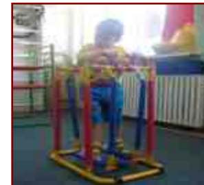
Мобильный реабилитационный кабинет