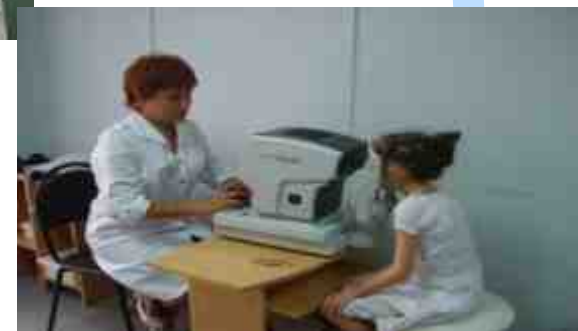
Проект по оздоровлению и реабилитации детей с ослабленным зрением