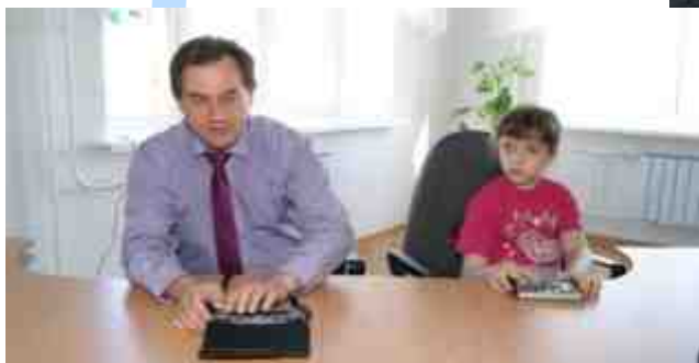
Брайлевский дисплей FOCUS-40 BLU, Брайлевский органайзер ESYS-12 и Брайлевский тифлокомпьютер PRONTO-16