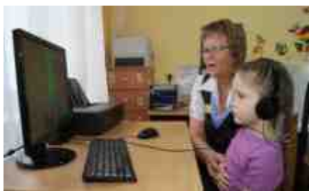
Логотерапевтический – аппаратно программный комплекс

Дети–инвалиды и дети, не имеющие инвалидности, с речевой патологией (В рамках путевки, ежегодный охват – более 500 детей) - http://centrpyshma.ru