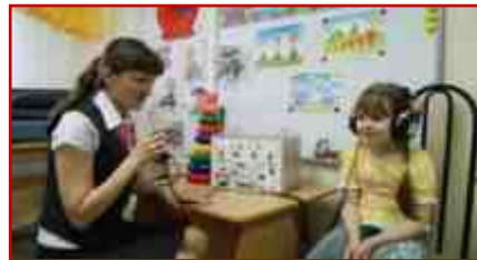
Центр медицинской и социальной реабилитации «Пышма»