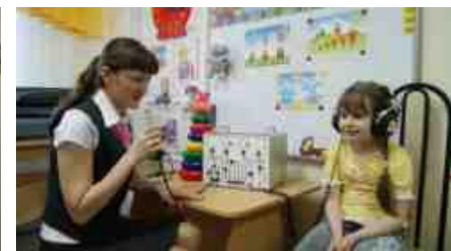
Программно-аппаратный комплекс «ВЕРБОТОН ВТ15»