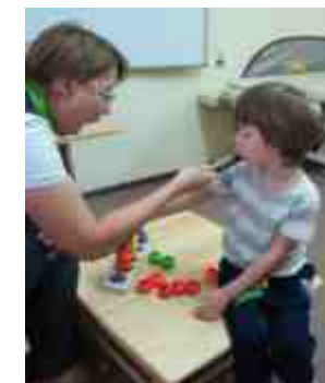
Верботональный метод академика П.Губерина