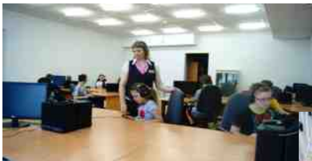
Обучение компьютерной грамотности с помощью современной информационной технологии - программы экранного доступа JAWS

Инновационные методики и технологии в реабилитации детей-инвалидов по зрению