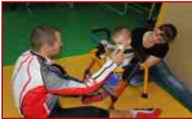
Областной центр реабилитации инвалидов