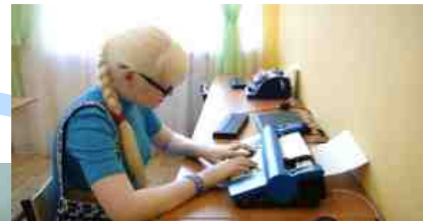
Тифлоприбор Mountbatten Writer + (электронная брайлевская пишущая машинка с речевыми и обучающими функциями)